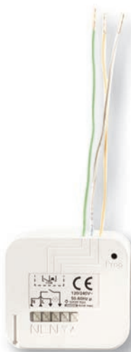
GO-ER MINI LIGHT