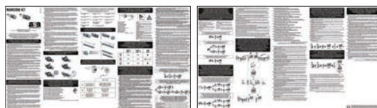
FOGLIO ISTRUZIONI INSTRUCTION LEAFLETS